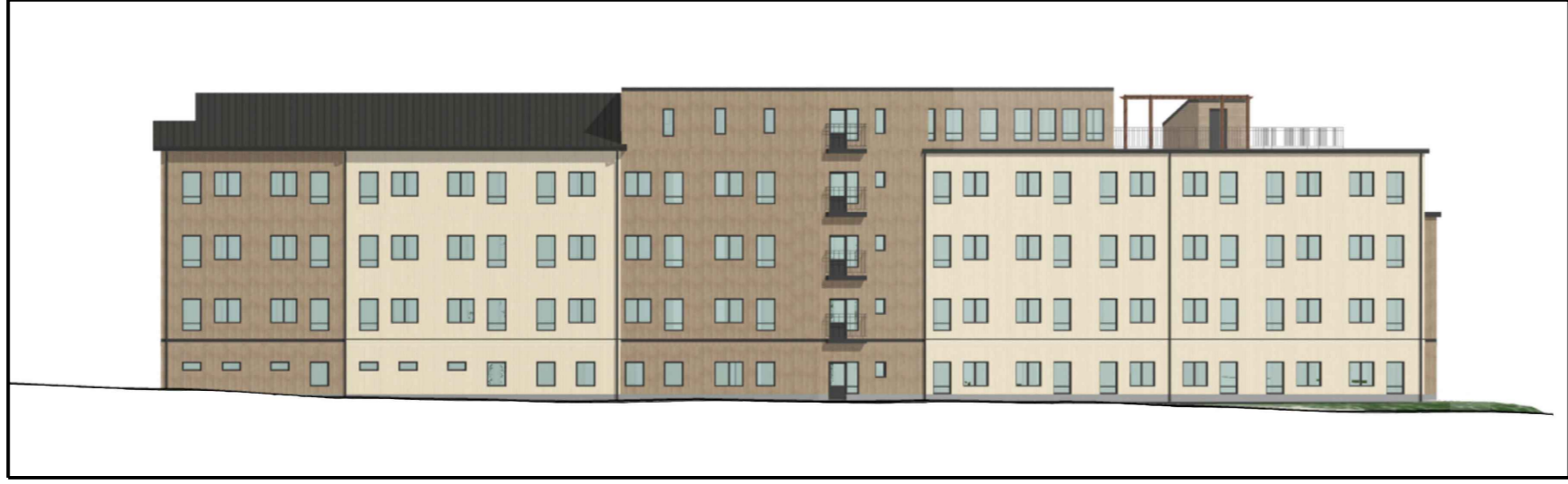
Illustration 1 - Principiell utformning och exempel på fasadindelning