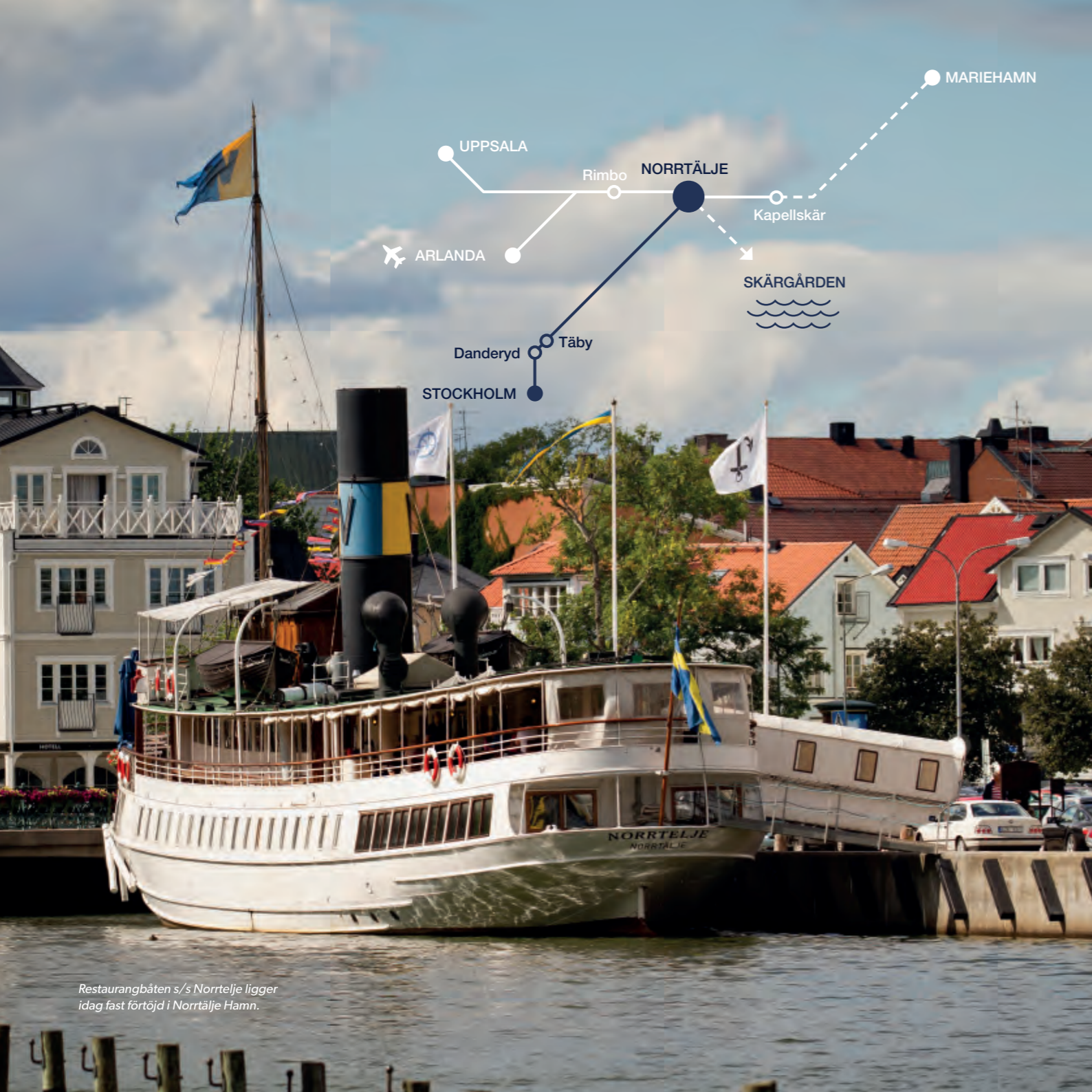
Restaurangbåten s/s Norrtälje ligger idag fast förtöjd i Norrtälje Hamn.