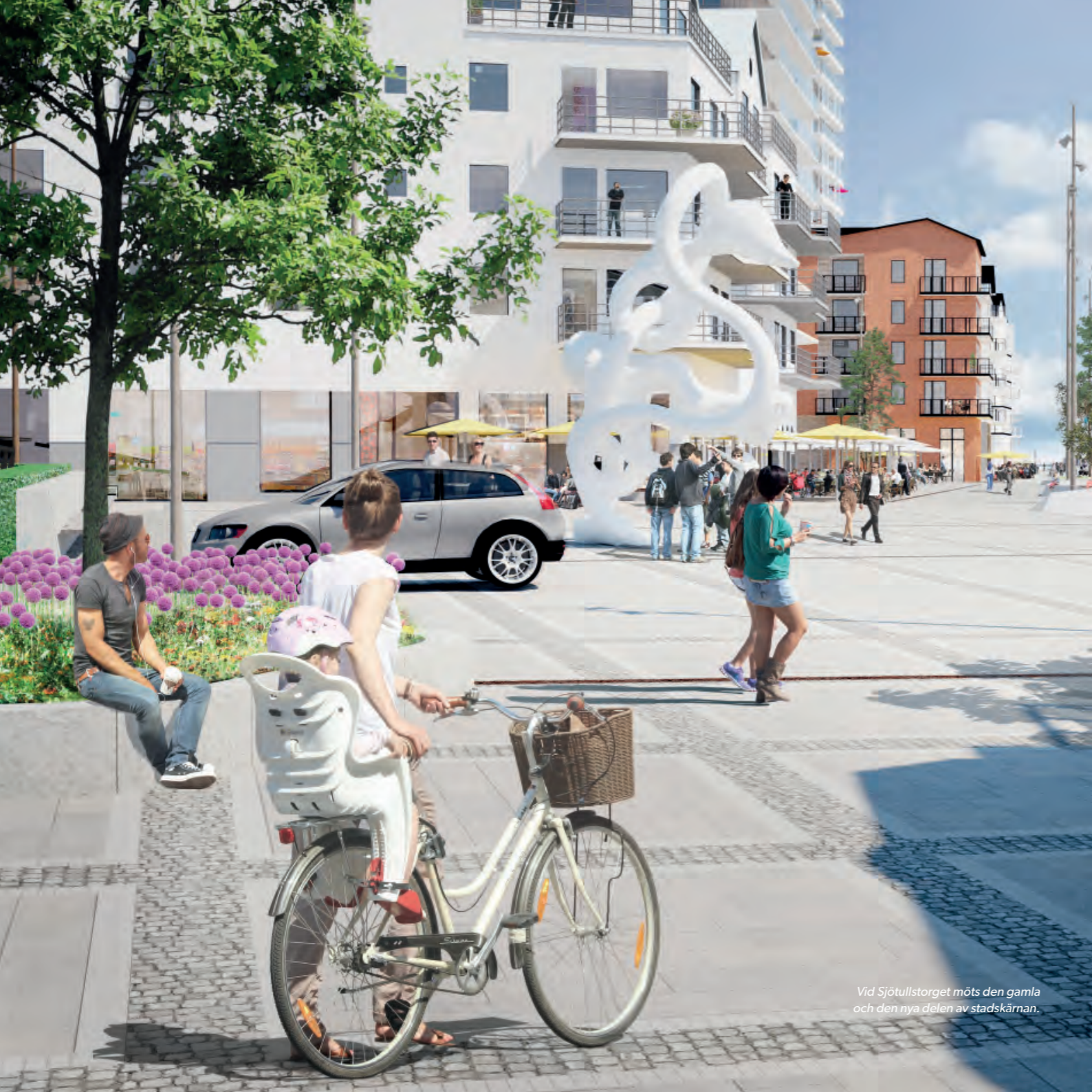
Vid Sjötullstorget möts den gamla och den nya delen av stadskärnan.