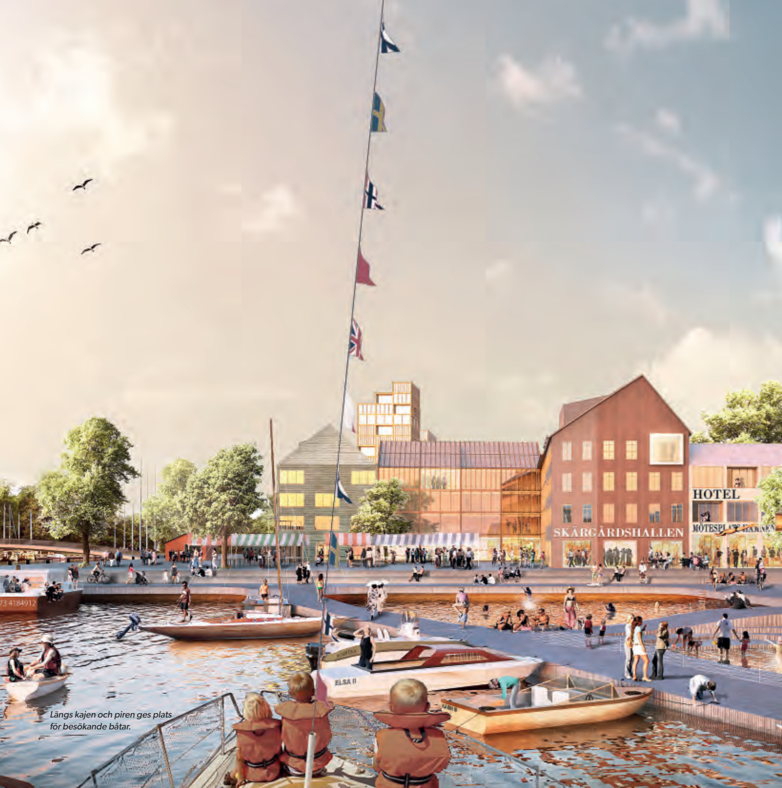
Längs kajen och piren ges plats för besökande båtar.