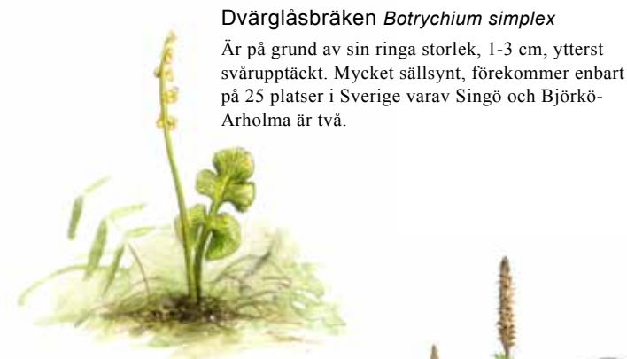
Dvärglåsbräken Botrychium simplex

Är på grund av sin ringa storlek, 1-3 cm, ytterst svårupptäckt. Mycket sällsynt, förekommer enbart på 25 platser i Sverige varav Singö och Björkö-Arholma är två.