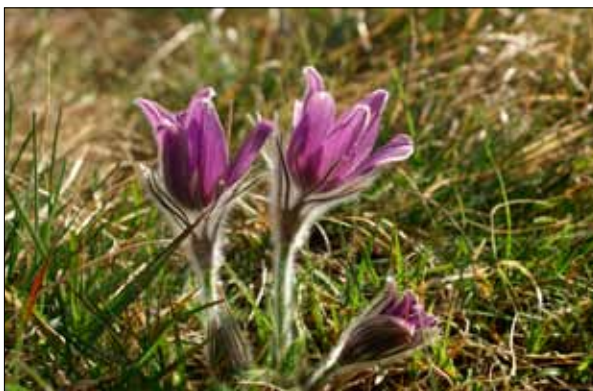
Baksippa är en av de fridlysta kärllväxterna i Norrtälje kommun. Den finns bara på Öbacken i Närtuna socken.

Bland de fridlysta växterna finns både välkända och eftertraktade arter, men även de som är mer sällsynta och svåra att känna igen. För de fridlysta växterna gäller förbud mot att plocka, gräva upp, ta frön eller på annat sätt skada växten. Samtliga vilda orkidéarter i Sverige är fridlysta. De ställer ofta speciella krav på sin livsmiljö och är därför väldigt känsliga mot förändringar i miljön. Bakgrunden till fridlysning av samtliga arter är bland annat att orkidéerna har utsatts för omfattande plockning och uppgrävning och att det förekommit illegal handel med sällsynta arter. I Norrtälje kommun förekommer ungefär 25 olika orkidéarter.