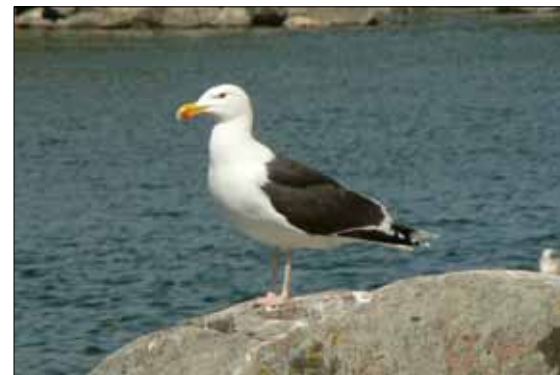
Havstrut häckar Norrtälje kommuns kustområde. Arten har ökat sedan 1970-talet.

Alla vilda fåglar och däggdjur är fredade i hela landet enligt jaktlagstiftningen. Undantaget är de tider på året som det råder jakttid för en del arter till exempel älg och rådjur, samt viss möjlighet till skyddsjakt. Övriga djurgrupper skyddas genom miljöbalken. Fridlysning av en djurart innebär att det är förbjudet att döda, skada, fånga eller på annat sätt insamla vilt levande exemplar av arten. Man får inte heller ta bort eller skada deras ägg, rom, larver eller bon. Fladdermöss är däggdjur och innefattas av den generella fridlysningen. Om de bosätter sig i bostadshus orsakar de i regel ingen skada men kan i vissa fall upplevas som störande. För att få flytta på fladdermöss krävs tillstånd av länsstyrelsen.