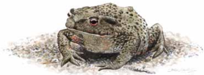
Vanlig padda Bufo bufo

Det är tillåtet att samla in mindre mängd rom eller yngel av följande arter för studier av utvecklingen; vanlig groda, åkergroda, vanlig padda, mindre vattensalamander, kopparödla och skogsödla. Ett krav är dock att djuren snarast återutsätts på insamlingsplatsen.