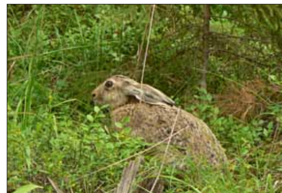
Fälthare förekommer i hela kommunen. Även skogshare finns i kommunen