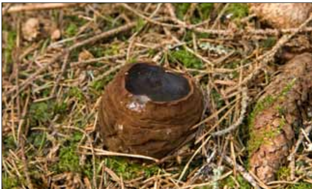
Bombmurkla finns bara på några få platser i gamla skogar i Edebo, Ununge och Edsbro socknar.

Insekter, tillsammans med ett flertal andra djurgrupper, hör till ryggradslösa djur. I Norrtälje kommun förekommer åtta fridlysta ryggradslösa djur, bland annat ett antal fjärilsarter. Fisk samt kräfdjur och musslor är fridlysta enligt fiskelagstiftningen. I Sverige är fisken mal samt flodpärlmussla fridlysta, inga av dessa förekommer dock i Norrtälje kommun.