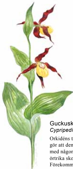
Guckusko Cypripedium calceolus

För gullviva, liljekonvalj och lummerväxter gäller förbud mot att plocka för försäljning eller att gräva upp. Det är dock tillåtet att plocka för husbehov.