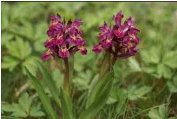
Adam och Eva växer på öppna marker efter kusten. Den är, som alla andra orkidéer, fridlyst i hela landet.

En art kan antingen vara fridlyst i hela landet eller enbart i delar av landet. Då det gäller fridlysning av en art inom ett län är det respektive länsstyrelse som fattar beslutet. Regeringen eller Naturvårdsverket beslutar om nationell fridlysning av en art.