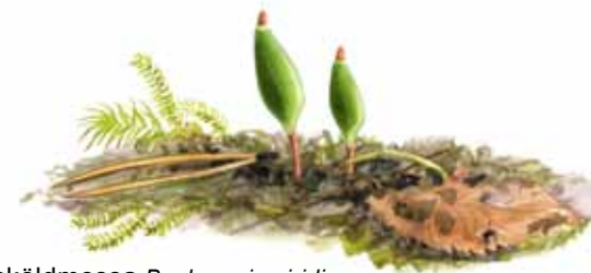
Grön sköldmossa Buxbaumia viridis Känns igen på sina gröna kapslar. Är mindre vanligt förekommande i kommunen i gammal skog med mycket död ved.

Orkidéns toffellika utseende gör att den inte kan förväxlas med någon annan art. Växer i örtrika skogar på kalkrik mark. Förekommer i den norra delen av kommunen.