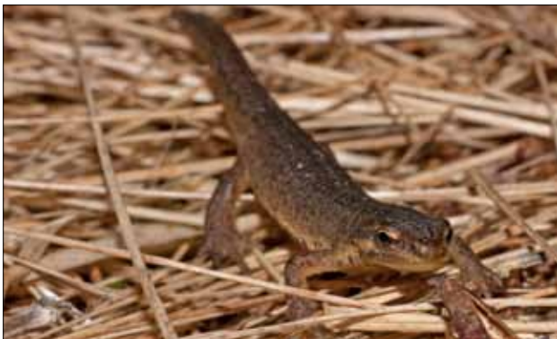
Mindre vattensalamander finns över hela kommunen.

Samtliga Sveriges grod- och kräldjursarter är fridlysta i hela landet och av dessa förekommer tio arter i Norrtälje kommun. Våtmarker och småvatten är ofta den typ av miljö som grod- och kräldjur är knutna till. I takt med att dessa miljöer har förändrats eller försvunnit helt har grodor, ödlor och ormar blivit allt mer sällsynta i våra marker. Det är inte tillåtet att fånga eller döda ormar i naturen. Huggorm utgör ett undantag. Om det finns huggorm på tomten får man flytta den och om ingen annan lösning finns får man i sista hand döda ormen.