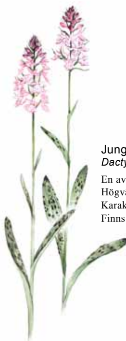
Jungfru Marie nycklar Dactylorhiza maculata

Tidig vårblomma med allmän förekomst i kommunens skogar.