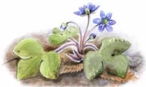
Blåsippa Hepatica nobilis

Är på grund av sin ringa storlek, 1-3 cm, ytterst svårupptäckt. Mycket sällsynt, förekommer enbart på 25 platser i Sverige varav Singö och Björkö-Arholma är två.