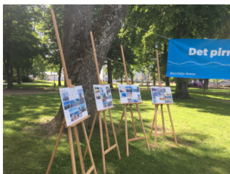
Staflin med mood-boards som användes under dialogen.