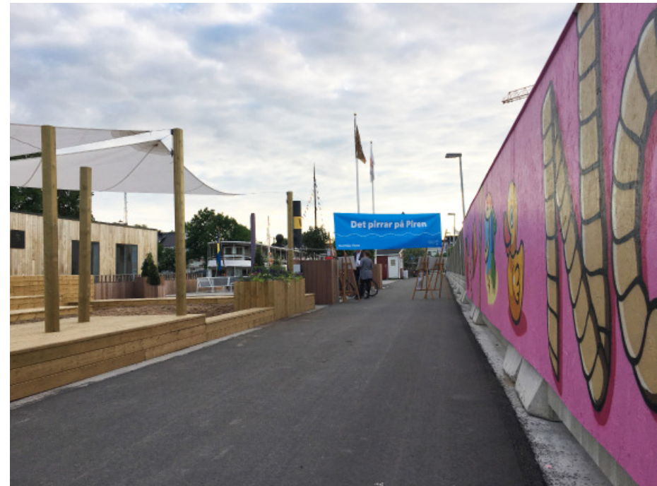
Bild från Vardagsrummet.