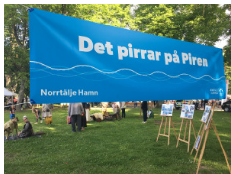
Banderollen i Societetsparken.