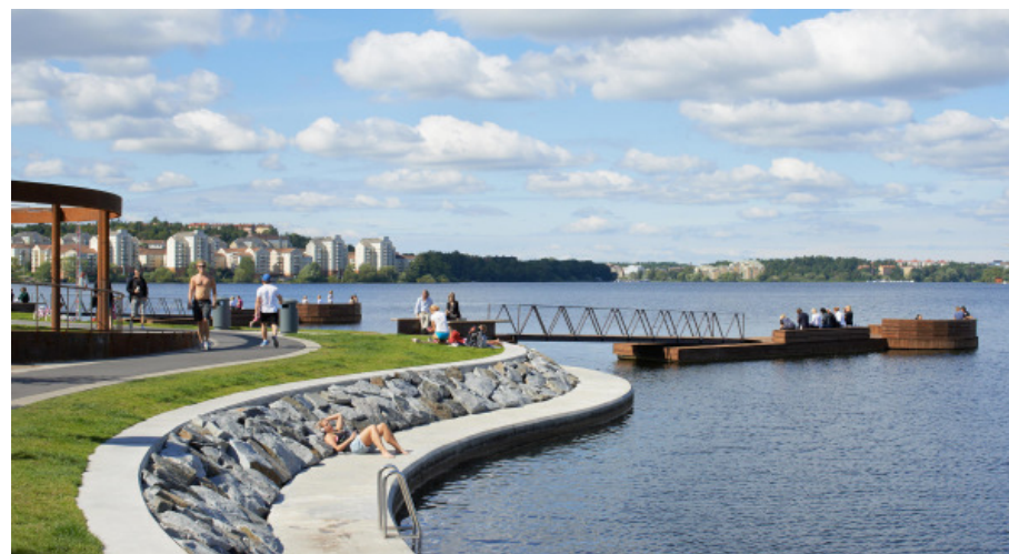
Hornsbergs strand i Stockholm nämndes som referens under dialogen.

Att Norrtälje Hamn upplevs som tryggt och att det är en inbjudande plats för alla invånarna i staden är ett återkommande svar. Ett flertal tillfrågade tar upp tillgänglighet som en viktig aspekt. Det är både tillgänglighet för funktionsnedsatta samt tillgänglighet som att Norrtälje Hamn blir en plats med offentliga ytor för alla stadens invånare som avses.