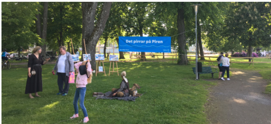
Bild från Societetsparken.