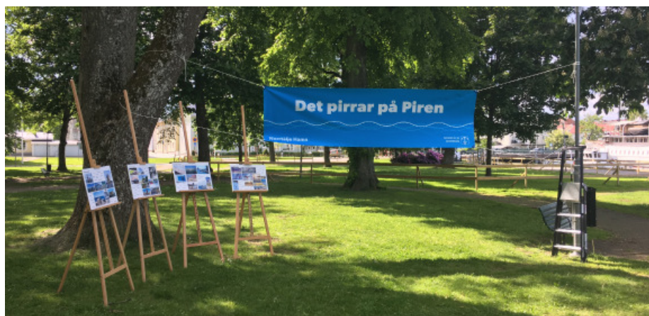
Bild från Societetsparken.

Ett av syftena med invånardialogen var att få in synpunkter från barn, ungdomar och unga vuxna eftersom dessa grupper har varit underrepresenterade i tidigare dialoger som Norrtälje Hamn har anordnat. Dessa tre åldersgrupper utgör tillsammans 50 st deltagare vilket är en majoritet av de tillfrågade.