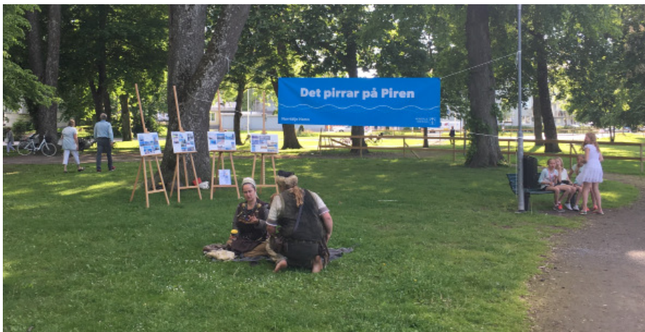
Bild från Societetsparken där invånardialogen hölls från kl 15-19.

I flera tidigare dialogtillfällen som t.ex. öppet hus i Norrtälje Hamns projektkontor har deltagarna främst utgjorts av äldre, därför var ett av syftena med invånardialogen att få in synpunkter från ungdomar och äldre vuxna.