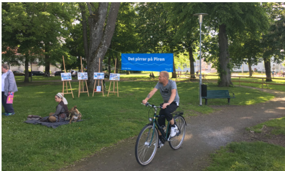
Bild från Societetsparken.