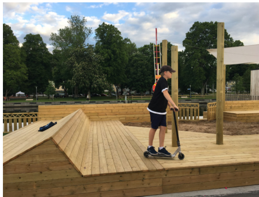
Vardagsrummet användes av både vuxna och barn.