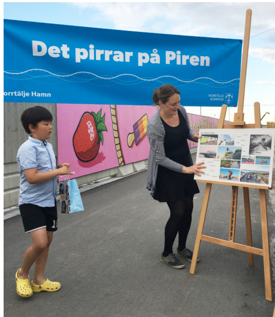
Bild från "Vardagsrummet" där invånardialogen hölls från kl 19-22.